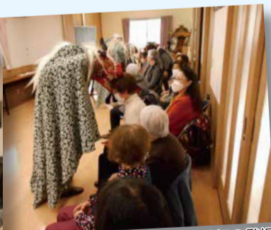
1月だったので獅子舞の登場