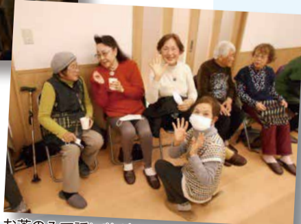
お茶のみで話が花が咲きます

社協だより10月号で瑞穂町において活動しているサロンのマップをご紹介したところ、「どんなことをやっているの?」など、お問い合わせをいただきました。今回から、サロンで行われているさまざまな活動を紹介します。