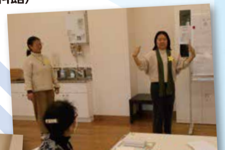
ジェスチャーゲーム

(活動日) 毎月第4木曜日 午前10時～11時 (活動場所) けやき館(瑞穂町郷土資料館) (参加費) 無料