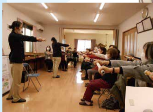
施設職員指導のもとで体操

(活動日) 毎月第2水曜日 午後1時30分～3時30分 (活動場所) 中三丁目会館(セブンイレブン瑞穂箱根ケ崎西平店隣) (参加費) 100円