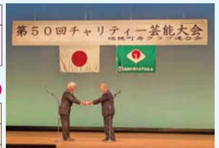
11月13日瑞穂町寿クラブ連合会様から