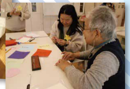
折り紙で交流(奥の方はアメリカご出身です)