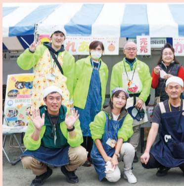
昨年も、おかげさまでからあげは両日完売しました。