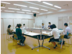
<相談支援のスキルアップに向けた連絡会>

障がい福祉サービス事業者と協力して、安心した地域生活を送るための支援体制を築きます