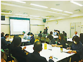
<障がい福祉サービス事業者向け研修会>