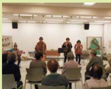
「アンデスの仲間たち」の演奏風景

違う曜日の利用者同士や、ボランティアさんが触れ合い、楽しさを共有し、皆さんいい笑顔でお帰りになっていました。