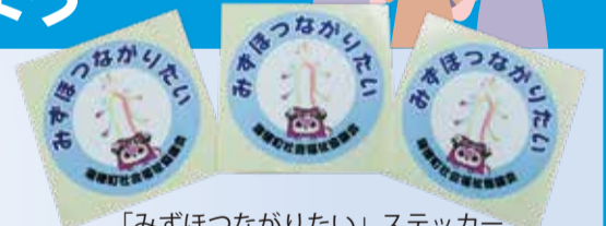
「みずほつながりたい」ステッカー