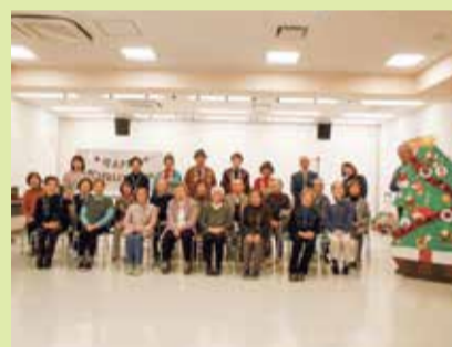
演奏後にみんなで集合写真