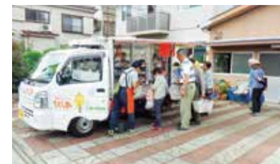
松山町では、地域での話合いの結果、移動スーパーが毎週来ています