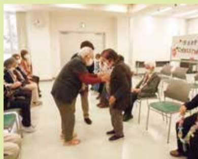
キャンディレイのプレゼント交換