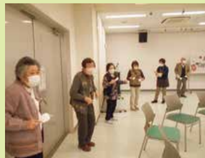
みんなで“ふくふく名物”ズンドコ体操