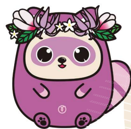
瑞穂町公式キャラクター みずほまる